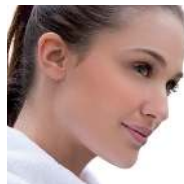
整形手术和美容医学