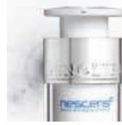
مستحضرات لمكافحة الشيخوخة