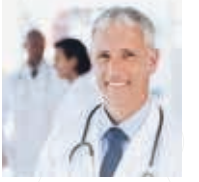
فحوصات طبية عامة