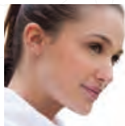
Chirurgia e medicina estetica