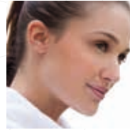
Ästhetische Chirurgie und Medizin